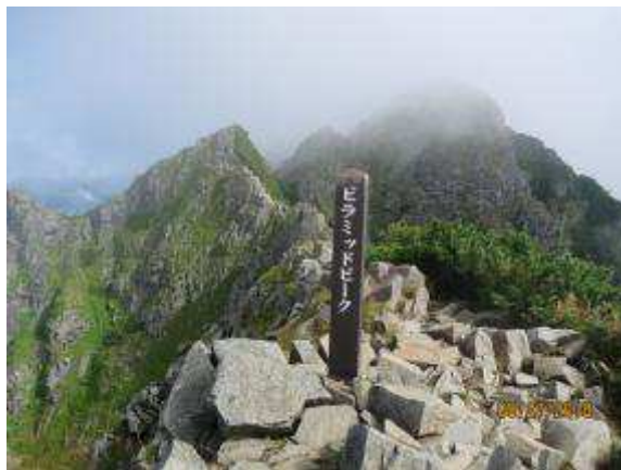
ピラミッドピーク（7峰）