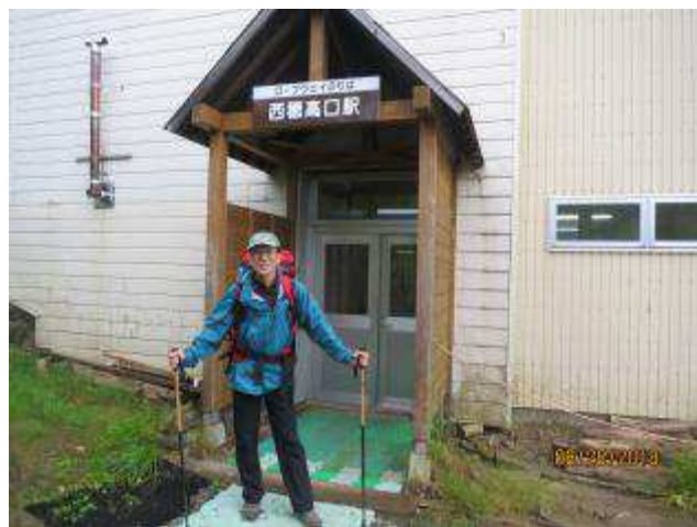
ロープウェイ駅に到着