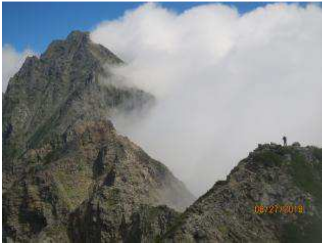
奥穂への稜線（さらなる難所）