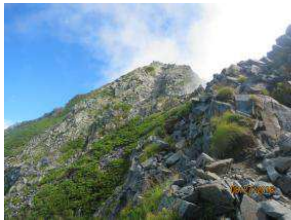
西穂山頂に近づく