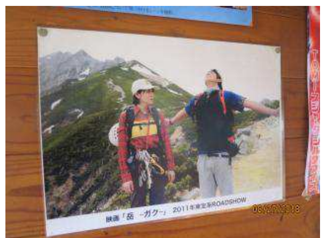
山荘の中には、女優、長澤まさみさんが、映画「ガク、岳」のロケで、撮影に来た当時の写真がありま