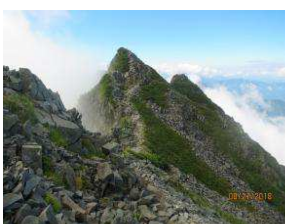
ノコギリ状の岩の稜線