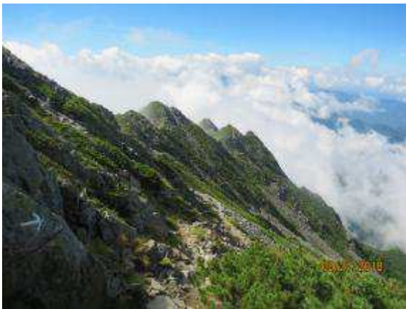
振り返ると・・・

チャンピオンピーク、4峰、2816mを過ぎると小ピーク（3峰、2峰）を巻いて、最後の急な登り 直下はフェイス状の、ちょっといやらしい登り（クサリが欲しいが、クサリなし）