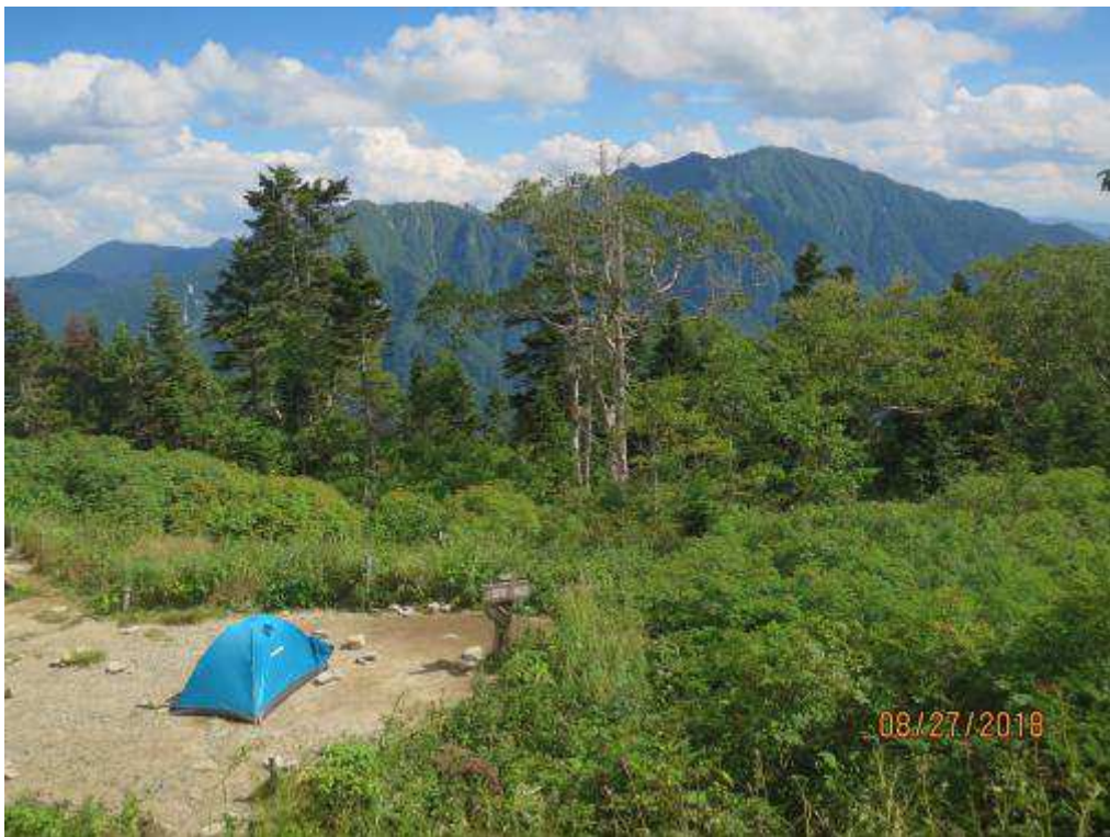
テントは7-8張りと少なくなった