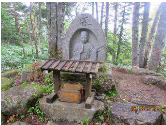
槍ヶ岳開山をした幡隆上人像