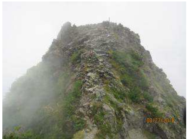
下りからの独標の雄氏