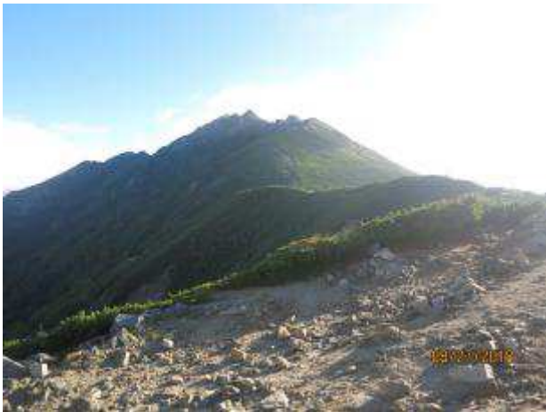
これから登る西穂高