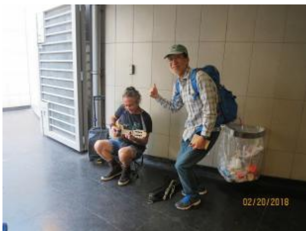
地下鉄の駅で路上パフォーマンス

地下鉄に乗る、スペイン語自販機で切符を買うのにちょっと手間取る トバラバ駅で降り、高層ビルに向かう