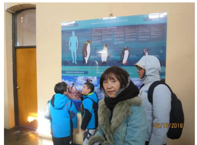
巣穴もみられる、小高い山には灯台があり小さな展示室があった