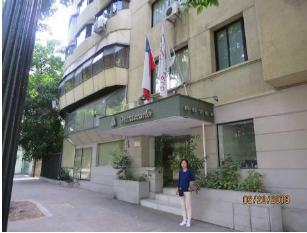
良いホテルでした