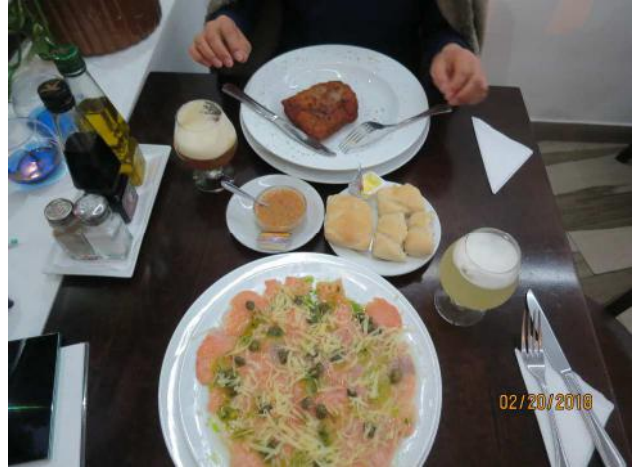
1階のレストランで夕食、ウェイタさんがフレンドリーで良かった