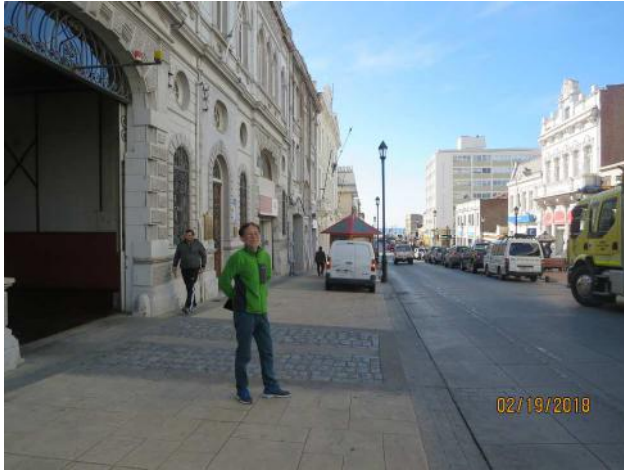
市内の展望の丘に登る、市街と海が一望できる