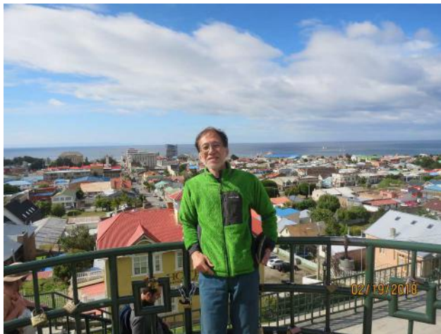
海辺の船と人魚のモニュメントを見る 早めに空港に行きチェックインする