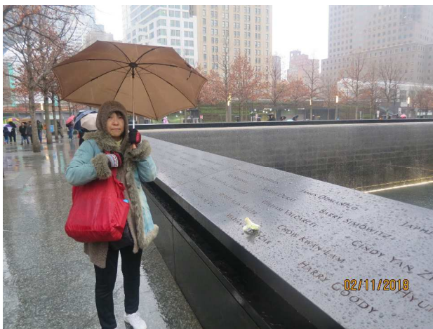
グラウンドゼロにて犠牲者の冥福を祈る！

フェリーを降り、マンハッタン街まで20分ほど歩き、グラウンドゼロで犠牲者の冥福を祈る