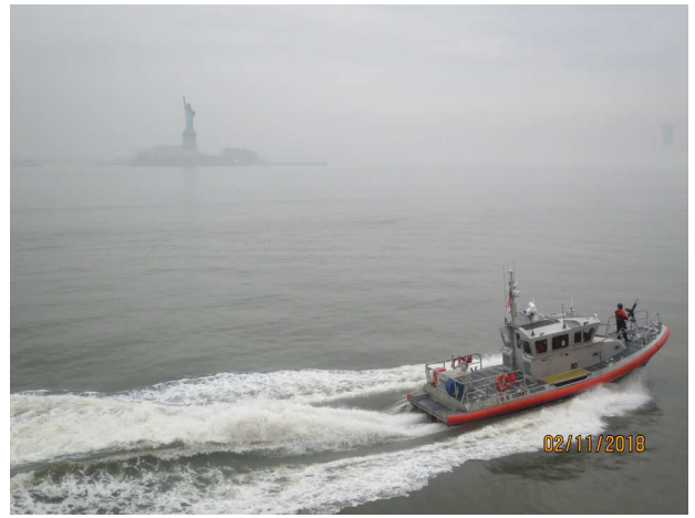
無料フェリーは観光にも最適

ステイテン島行き島民用の無料フェリーに往復で乗り、自由の女神をじっくりと見学する NY湾からマンハッタンのビル街も良く見えた