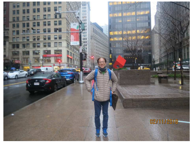
マンハッタンの風景

フルトンストリート駅から地下鉄に乗り JFK 空港に戻る (3 ドル+5 ドル)