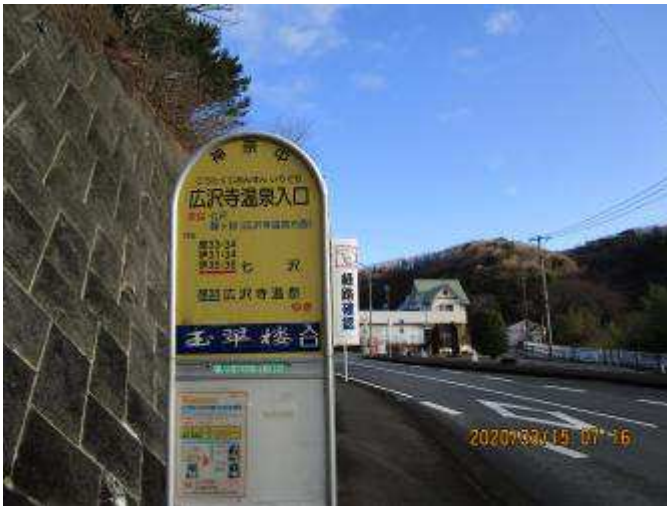
広沢寺温泉入口バス停

広沢寺温泉バス停を降り、しばらく舗装道路を広沢寺温泉方面に行くと鐘が岳登山口に着く。登山口を右に入るとやがて登山道となる。