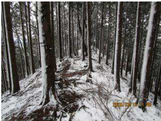
快適な雪尾根歩き