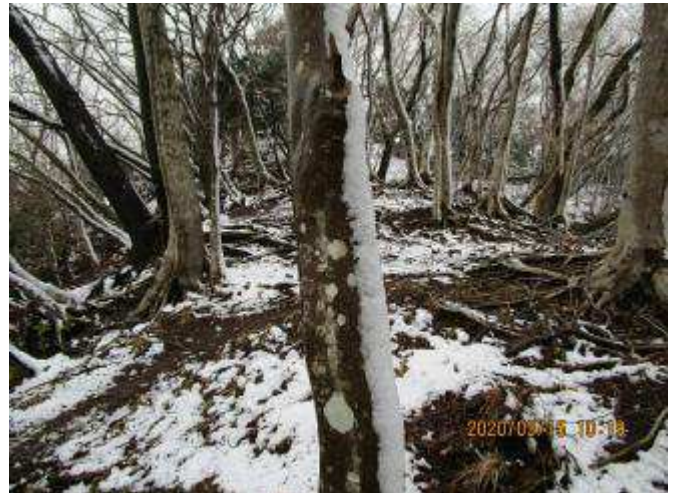
雪が多くなってきた