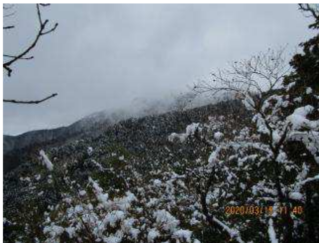
大山頂上は雲の中