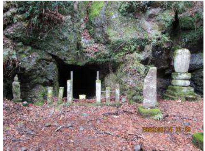
旧浄光願寺跡の洞窟