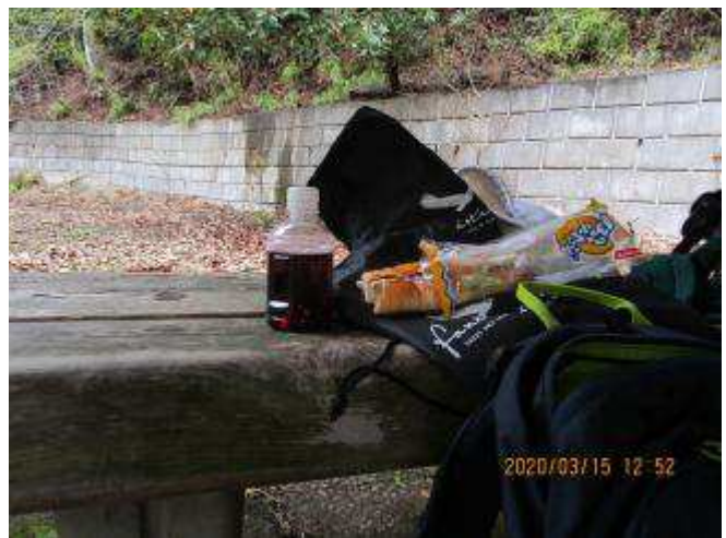
ワインを飲んで・・・