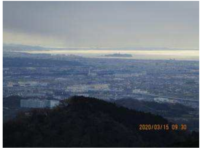
高層ビル群や江の島が良く見えます