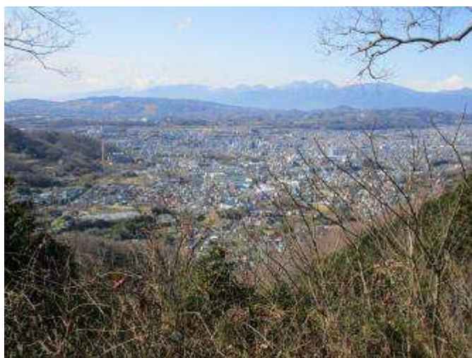
念仏山の大展望、遠くは箱根の連山