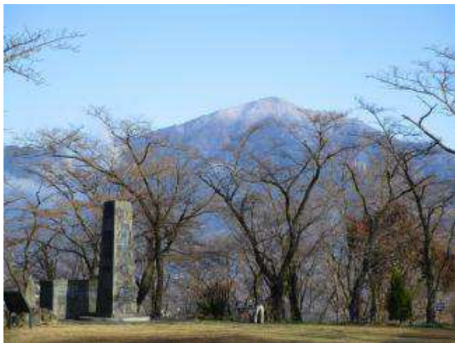
権現山から雪の大山