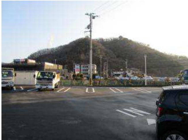
秦野市街から権現山

駅の北側の市街を流れる水無川沿いの道を東へ進む 10分ほど歩いて大きな道路を北へ100m進むと登山道入り口である