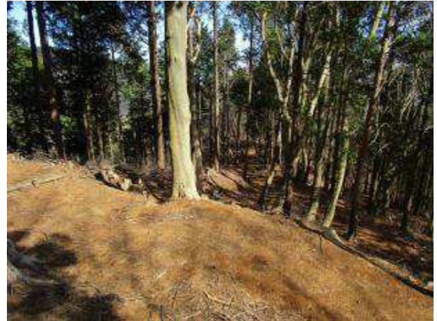
浅間山東尾根の下り

今日はもう充分歩いて疲れてきたので、大山山頂はあきらめてこの辺で下る事にする 下りは地理院地図に示されている点線を東へたどる 特に指導標もないが、踏み跡があるため、適当にルートファインディングしながら進む ヤブはない 最後は急な下りとなり、尾根の左側を下り、大山第一駐車場に出た