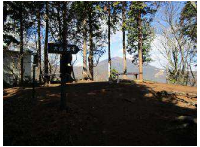
静かな木陰の高取山