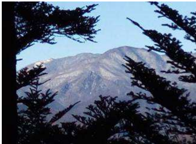
小金沢連嶺の雪山

扇山への登りでは、うっすらと雪が積もっていた。 遠くに南アの聖岳、赤石岳が見える。 小金沢連嶺は白く雪化粧。