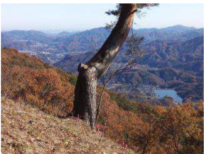
犬目丸から大野池と上野原の町