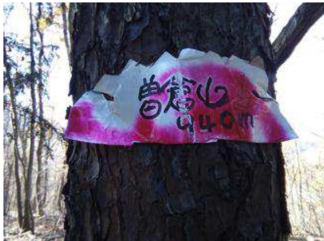
浅川峠～扇山間に曾倉山がある