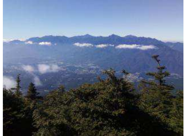
南アルプス、甲斐駒や北岳