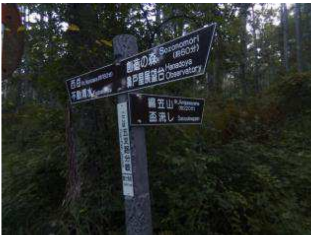
西岳へのルートとの分岐

登山道は前半はなだらかの登りで歩き易いが中盤は急登が続く。ずっと樹林帯が続くが、下草が少なく見通しが良く気持ちの良い高原の登山道。