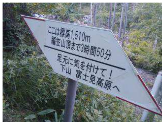
詳細な標識が多数あり