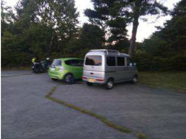
富士見高原駐車場