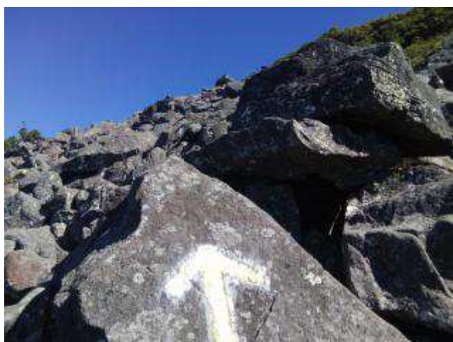
頂上直下は岩がゴロゴロ