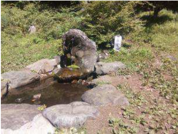
下りの途中の水場（不動の清水）で顔を洗う