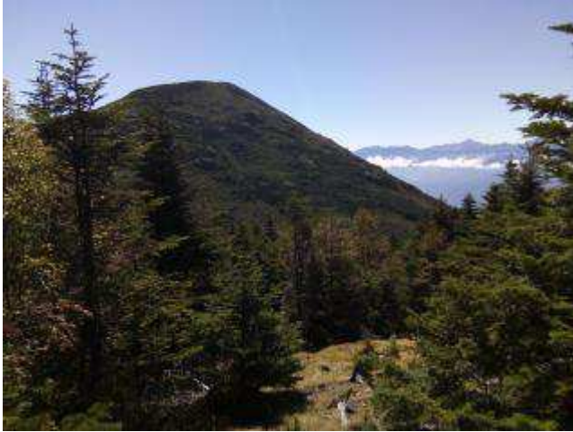
西岳への道から編笠山

テント場にも 10 張りぐらいのパーティがいる。 小屋から 10 分ほど歩くと豊富な水量の水場がある。西岳から来るすれ違いの登山者も多かった。西岳への道は平坦で歩き易かった。