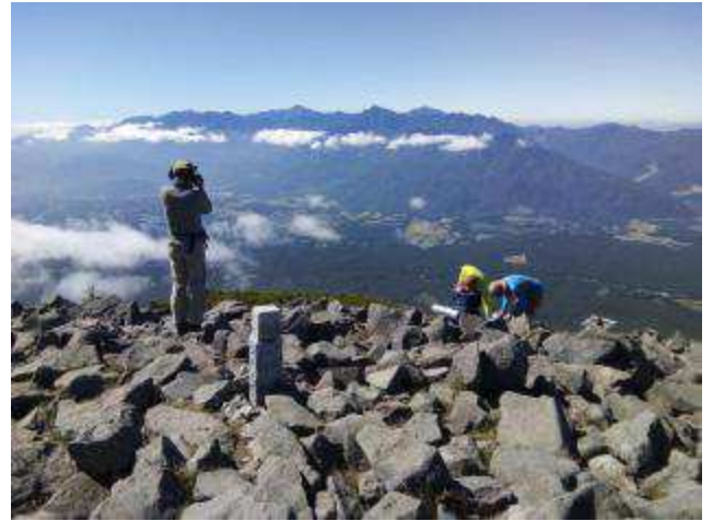
とても居心地の良い広い頂上でした