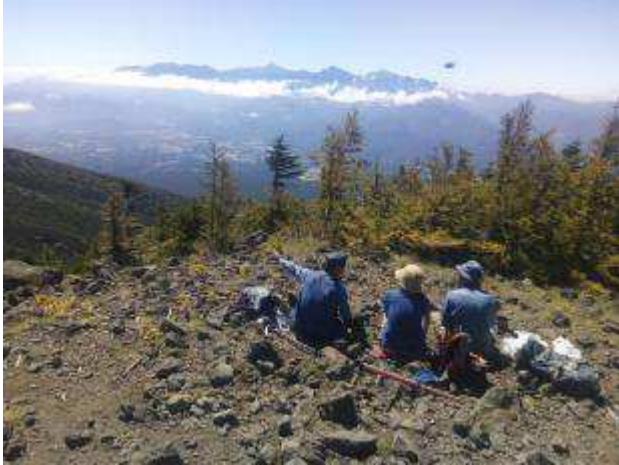
西岳から南アルプス