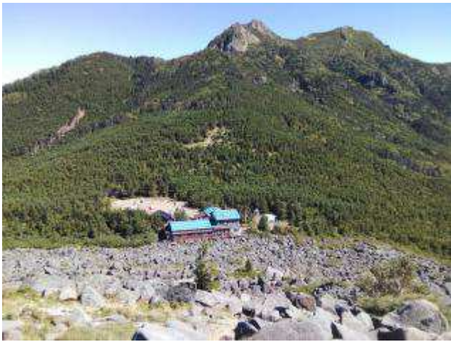
編笠山からの下り