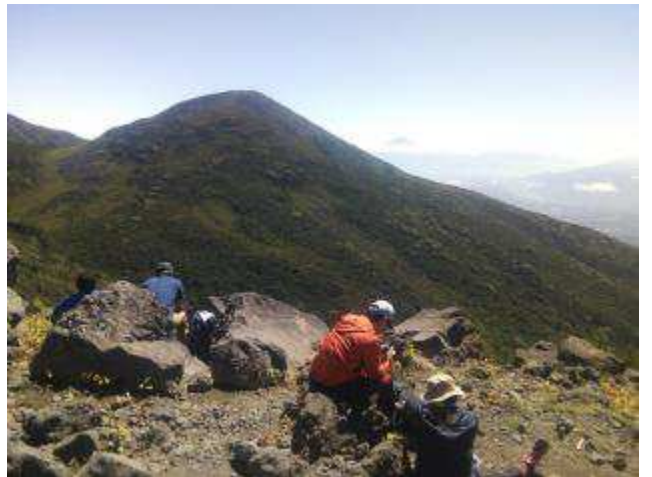
展望の良い西岳も人が多かった

西岳からの下りでも登ってくる登山者が多い。犬を連れて登る人もいた。 下りの道はフカフカで歩き易かった。下りに使って正解でした。