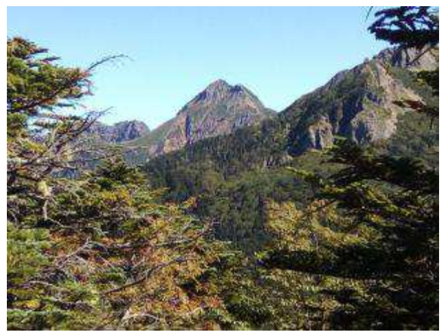
下り途中から赤岳