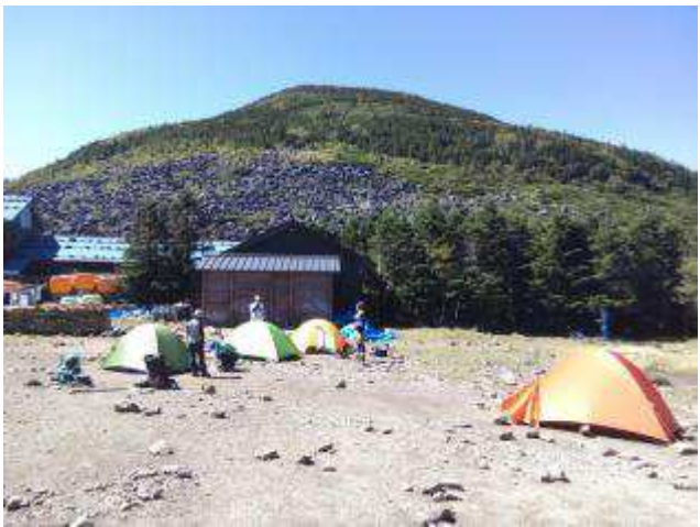
青年小屋から編笠山