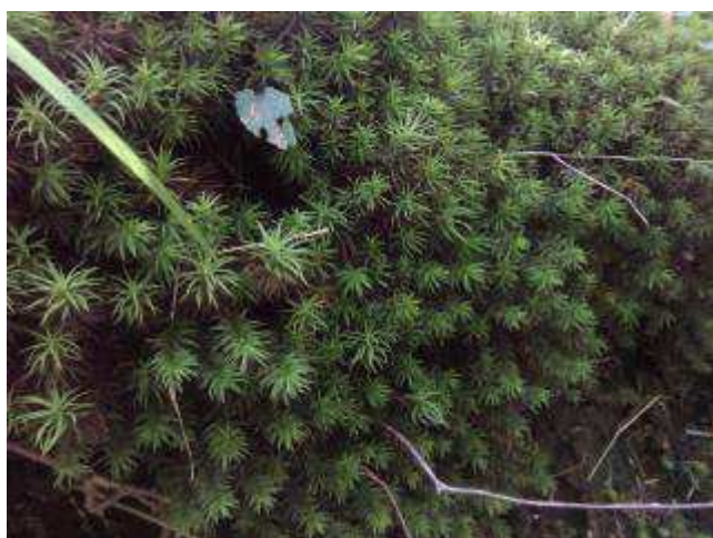
きれいなコケが多い