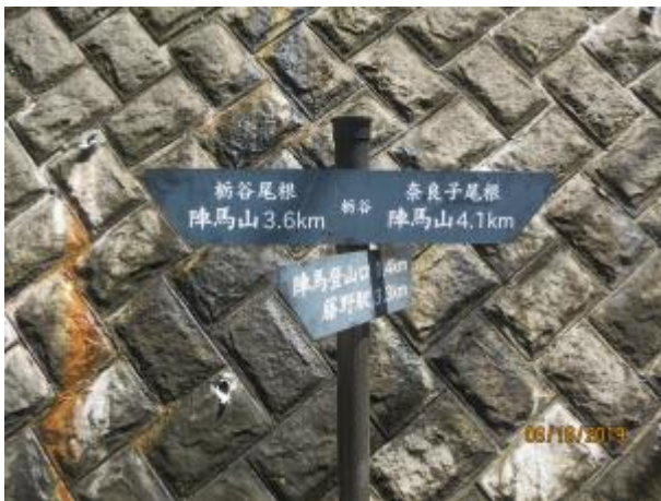
途中の道路の分岐

バス停から陣馬の湯方面へ、しばらくは舗装道路を登る 道路の後半は、ジグザグでかなりの急登である