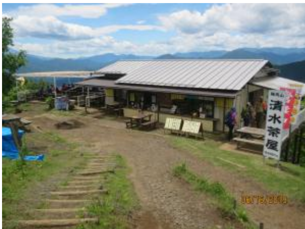
頂上の西側、清水茶屋

生藤山の緑、森が吸い込まれそうで圧巻である 今日は頂上の西側にある「清水茶屋」に入る