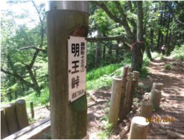
明王峠が縦走路から相模湖への分岐点