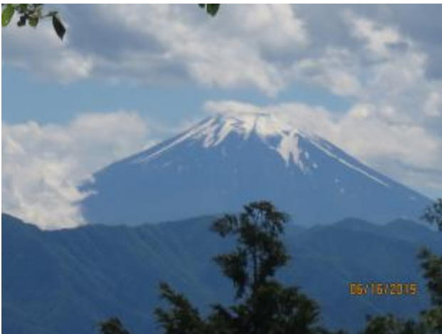
富士山が顔を出した