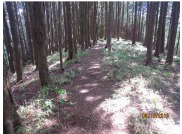
静かなピーク、矢の音の頭

矢の音ピークから奈良本へ下るコースは、今回初めてである このコースはマイナーで登山者は歩いていないが、道は広くバッチリである しばらく水平な尾根道をどんどん行く 途中から地図読みで南側の林道と並行した尾根道を探しながら進む 最後の小ピークから南へ下る尾根は踏み後を頼りに下る