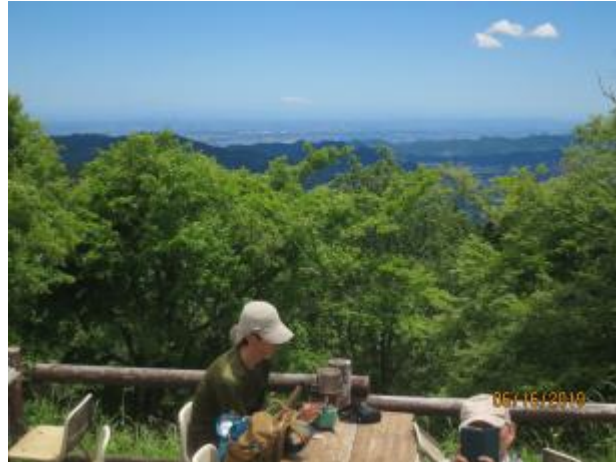
東京方面の街並み