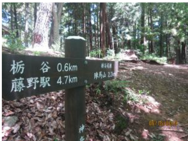
栃尾尾根に上がる

道路だけで高度を稼ぐ、気温は暑くなく、風がさわやかで絶好の登山季節だ すでに下山者が何人かいる