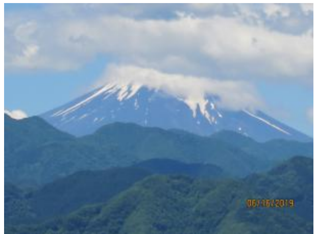
富士山が見えてきた