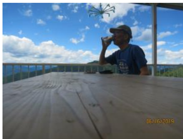
青空の下で、ビールがうまい！