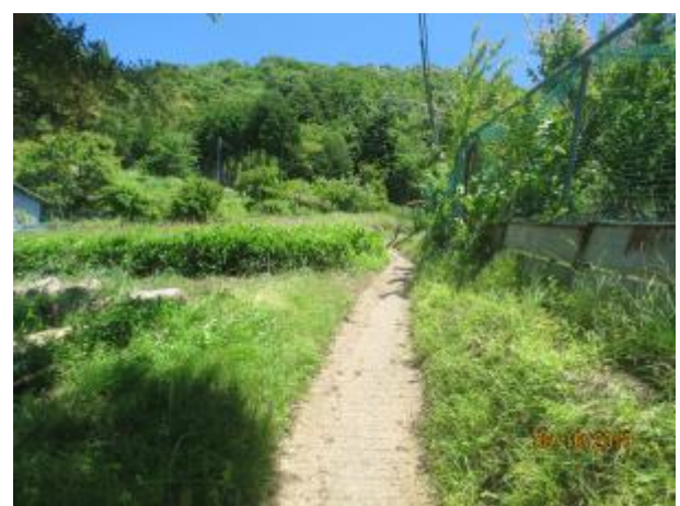
尾根への登りが始まる