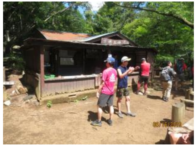
茶屋にビールも有り