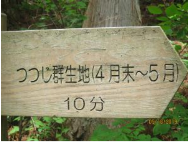
5月のおすすめコース