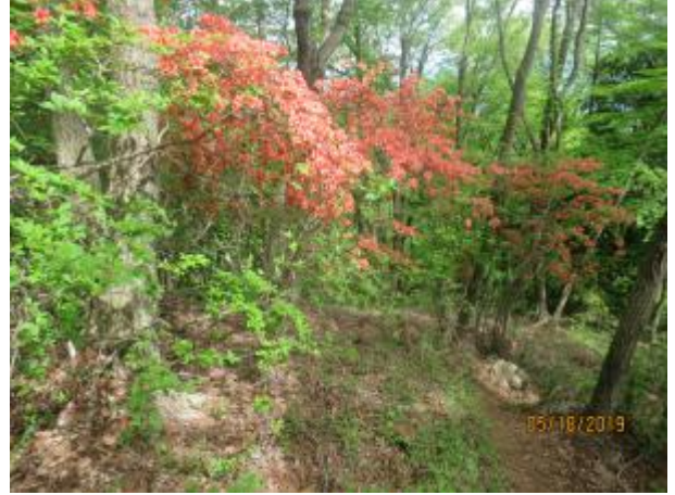
ツツジが延々と続く