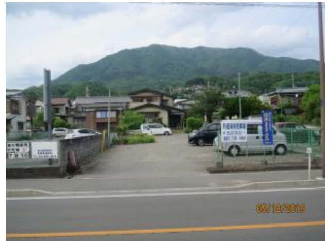
鳥沢の街から扇山