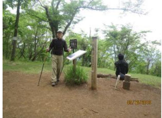
頂上は広くてきれいなところ

今日はアイスコーヒーや豆乳などのドリンクの種類を少し増やして持ってくる 休憩中が喉をうるわし、味も楽しむ！！