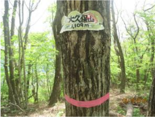
扇山の手前のピーク