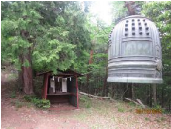
鐘と祠（ほくら）があり、中に不動明王がまつられている