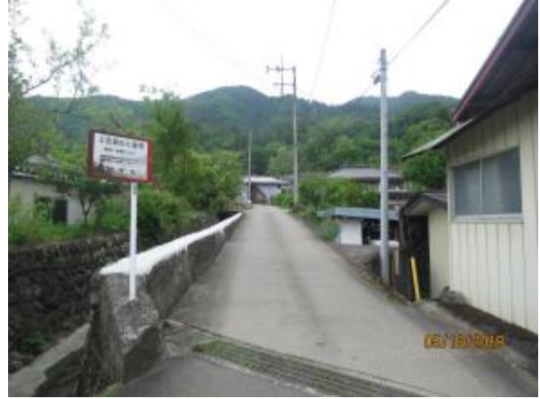
しばらく林道歩き

しばらく車道を登る、標識あり、車道は分岐があり注意が必要 山道に入るとだんだん急になる しばらくは樹林帯の登りが続く 今のところ曇りなので暑くなく幸いである