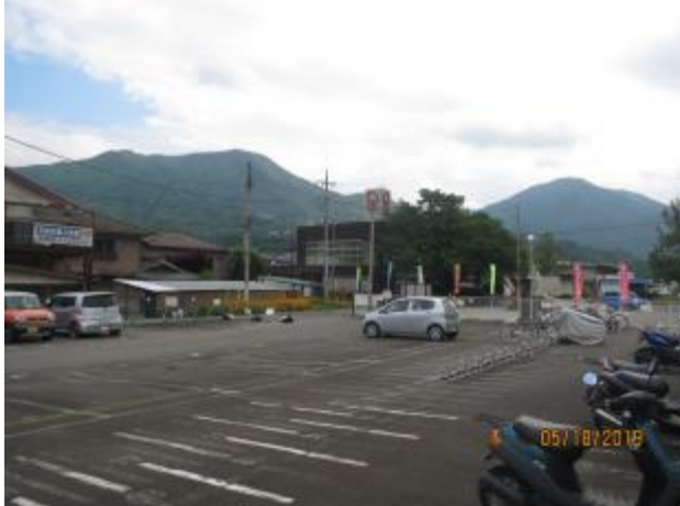
猿橋駅から左・百蔵山と右・扇山の風景