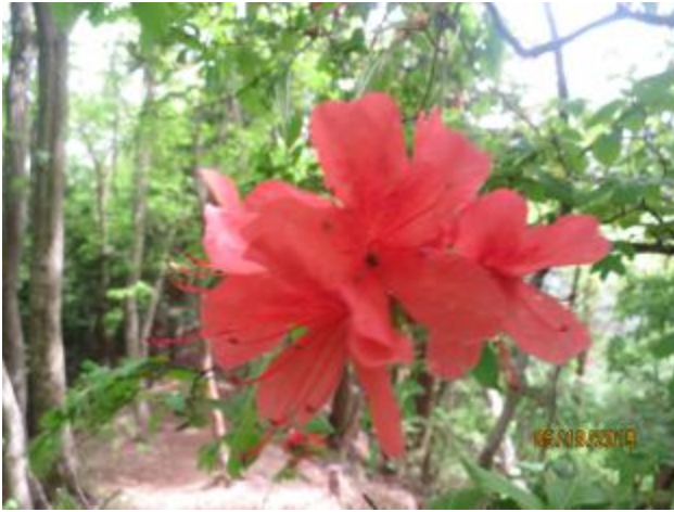
咲き誇っています！