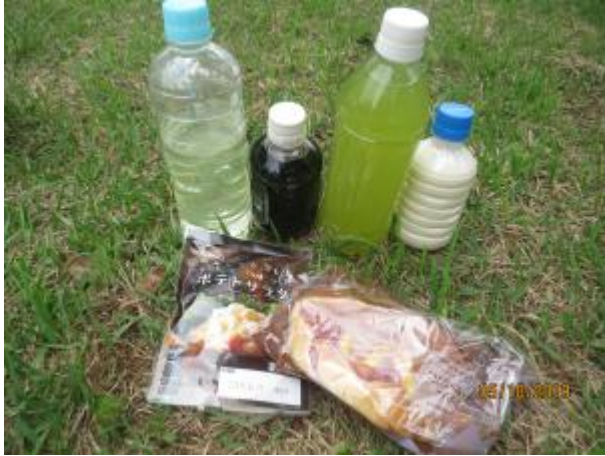
左からレモン水、アイスコーヒー、緑茶、豆乳 下はポテトサラダ、パン